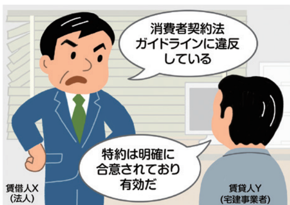
イラスト：おのひろゆき